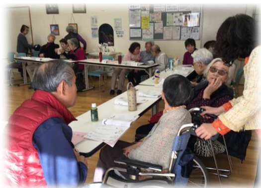
休憩時間も笑顔とおしゃべりが絶えませ