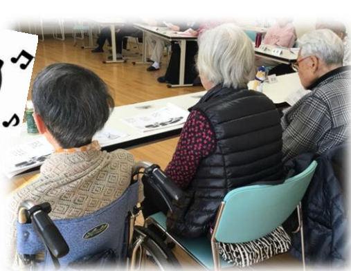
寒さに負けず大きな声で歌います