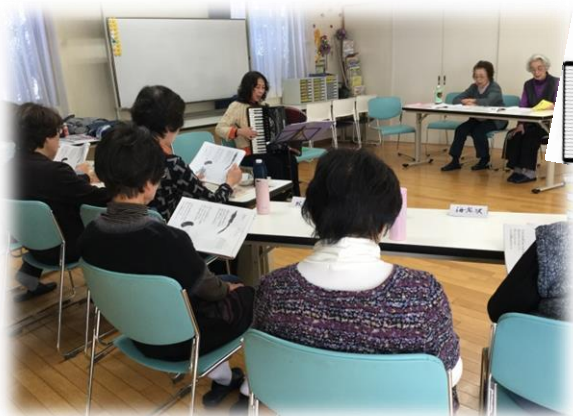
プロのアコーディオン演奏はとても贅沢

プロのアコーディオンの演奏に合わせて懐かしの童謡を皆で歌うとってもにぎやかなサロンです♪ 昔小学校で歌ったり、口ずさんでいた歌、お母さんやお祖母さんが歌ってくれた歌などを思い出し、懐かしい気持ちで元気に歌います。たまがわ歌声サロンは毎月第1水曜日 10時~11時半に宇奈根ふれあいの家で活動しています。休憩時間も笑い声が絶えない明るいサロンですので是非どなたでも見学にいらして下さい！