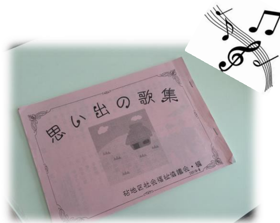
「思い出の歌集」には懐かしい歌が沢山

★社協ではお買い物ツアーや移動販売会等の住民の声を聞く協議体を開催しております★