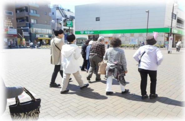
みんなで揃って一斉に買い物開始です。

4月16日(火)『第9回お買い物ツアー』を実施しました。今年度初めてのお買い物ツアーは暖かい陽気と快晴に恵まれ、9人の方に参加いただきました。食料品のみならず雑貨や衣類を購入されたり、晴天の下で駒大の学生ボランティアや参加者同士で談笑する姿も見られました。今回初めての方も「どういものか興味があって参加したけど欲しいものが買えて良かった。」との感想を頂きました。次回は年号が変わり令和元年5月15日(水)に実施予定です。