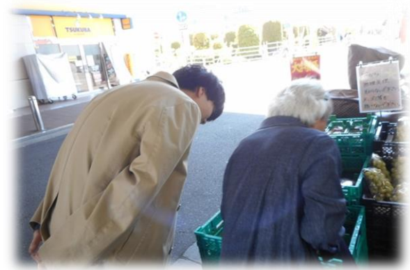
お目当ての野菜を探し中・・・