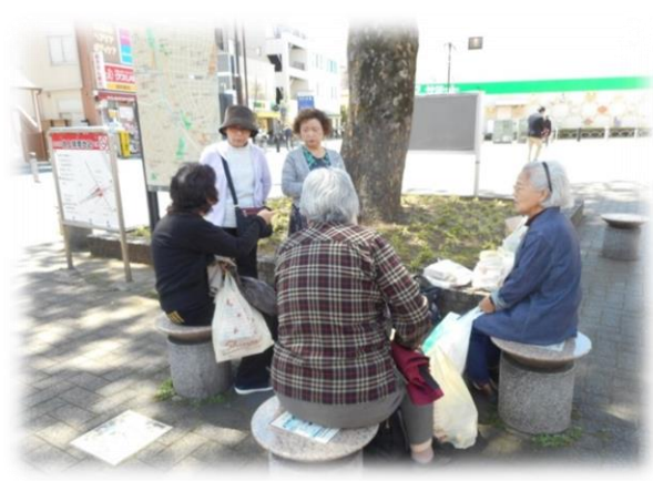
今日の晩御飯のおかずについて主婦同士の情報交換中。

★社協ではお買い物ツアーや移動販売会等の住民の声を聞く協議体を開催しております。是非ご参加下さい。