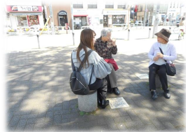
沢山買い物をした後は、お茶を飲みながら一休み。