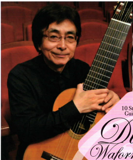
10 String Guitar