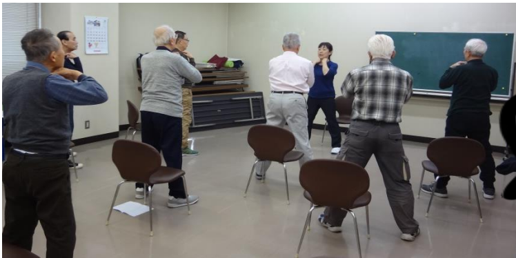
昔取った杵柄。体幹トレーニングもクリアです！

～男性の方を対象に、地域で気軽に集える場所を目指して活動しています～ ゴルフ・ウォーキングなど…何かと筋力、柔軟性が必要！ このプログラムならきっと楽しく続けられますよ♪ 未来の体は変えられる。