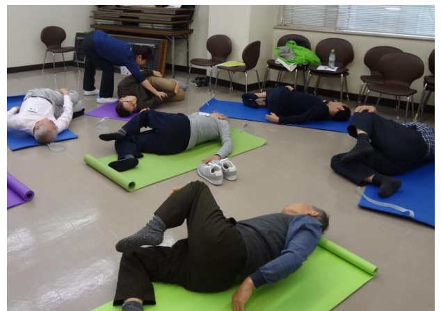
後半のマット運動。 硬い身体も少しずつ柔らかく。