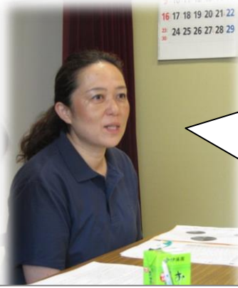
おでかけひろばの活動や協力等について