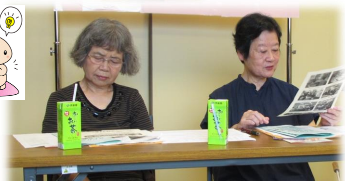
「子育てに関するアンケート調査」について報告 4/20 野沢地区社協 小動物ふれあい交流会 5/11~12 下馬地区社協 環境フェスタ