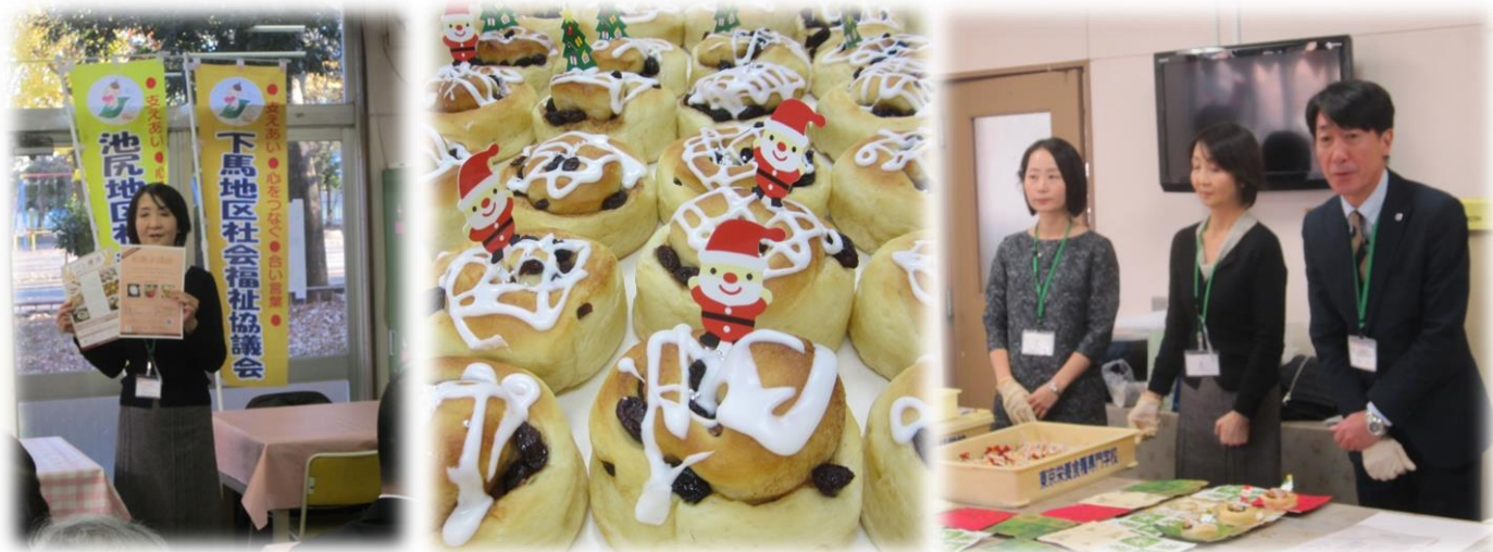
食糧学院さんの手作りパン（シナモンロール、お好み焼きパン）は大変好評でした♪