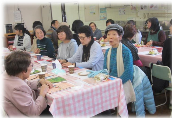
パンが美味しくて♪また参加したいです。