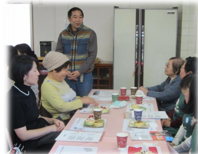
お母様と一緒に参加してくださいました。