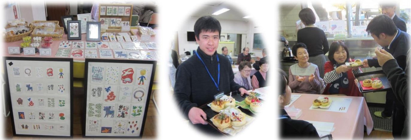
世田谷福祉作業所の皆さん。参加者の方におもてなしの言葉を添えてお届けします。