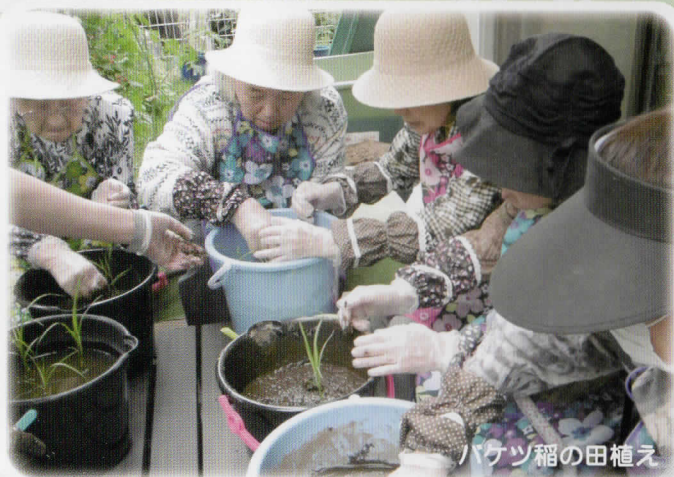
バケツ稲の田植え

植物の持つちから 土と触れ合うなごみ 自然と弾む会話 気持ちに誘われて いつしか動き出すからだ