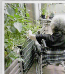
車椅子対応ガーデン