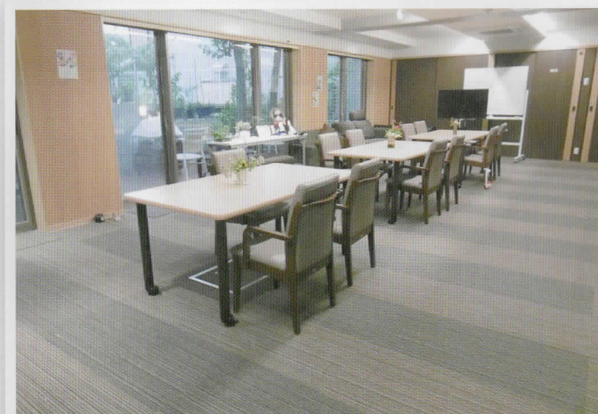
ダイニング(機能訓練室)

窓全体がガーデンに面した広くて開放的なダイニングです。車椅子のまま出入り出来るバリアフリーな環境で、どなたでも楽しんで頂けます。