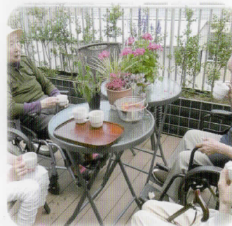
▲ テラスティータイム