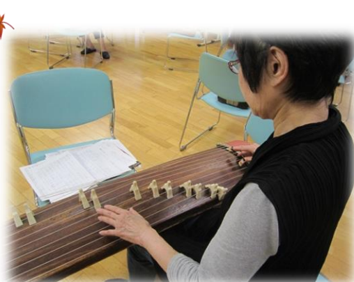
経験30年のベテランの演奏はプロ顔負けです。