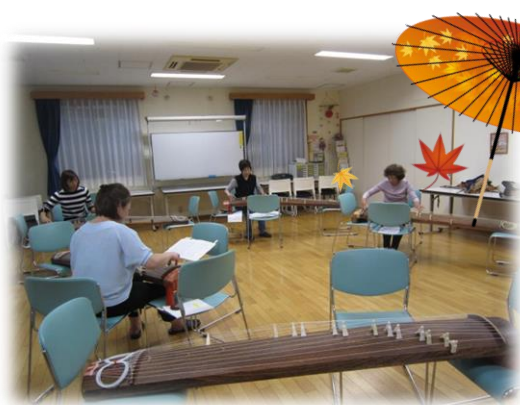
琴の美しい音色がふれあいの家一杯に

琴の調べは今年の6月に出来た新しいサロンです。参加者は数十年の経験の方から数ヶ月の初心者の方と様々で、従来の古典曲から唱歌まで幅広いジャンルの曲を演奏します。初心者の参加者も「まだ始めて日が浅いけどとても楽しい。」と笑顔が溢れます。琴の音色は聴いている者を和の空間へと誘ってくれます。第2金・第4木 15:00~17:00に宇奈根ふれあいの家で活動しているので琴を持っていない方、初心者の方でもご興味のある方は是非見学にいらして下さい。