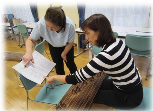
お互い助け合いながら活動しています。